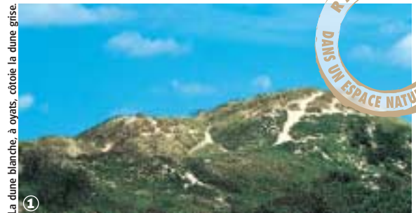
La dune blanche, à oyats, côtoie la dune grise.

la Flandre Côte d'Opale, terre précieuse