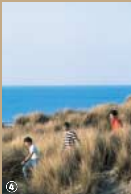
Cheminement parmi les oyats.