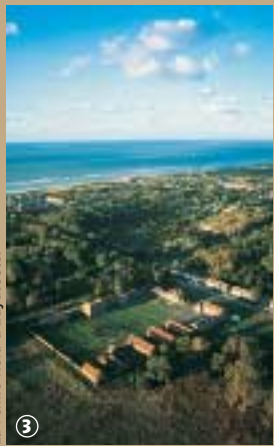
La Ferme Nord à Zuydcoote.

Les fans de Jean-Paul Belmondo se souviennent peut-être du film « Week-end à Zuydcoote » sorti en 1964. L'histoire, en dépit du titre et du fait que Zuydcoote est une station balnéaire, n'a rien de romantique. L'action se déroule durant la Seconde Guerre Mondiale et évoque les désenchantements de quatre soldats français. Elle